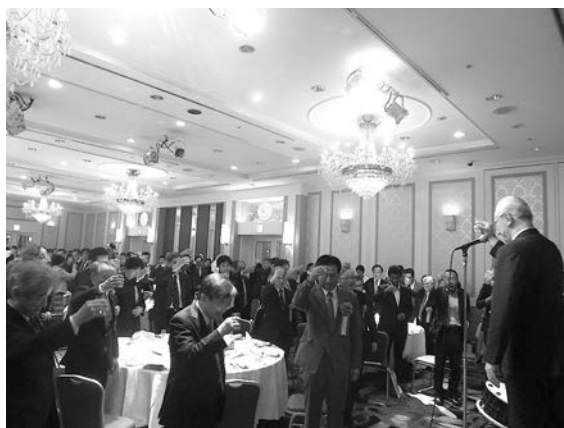
佐賀大会の成功を祝って全員で乾杯

は、佐賀県武雄市の「柄崎太鼓」青年若衆による勇壮な和太鼓が参加者のみなさまをお出迎え。最後は手締め「博多手一本」で長い熱