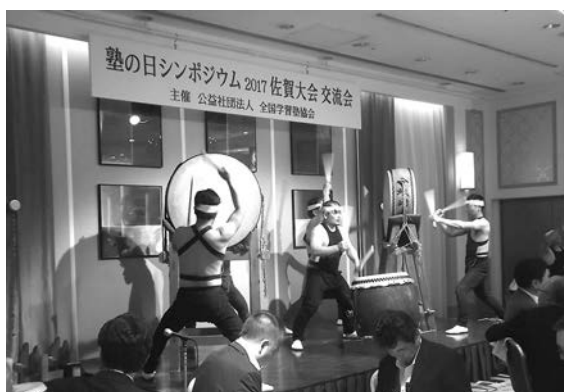
勇壮な！佐賀・武雄の柄崎太鼓でおもてなし