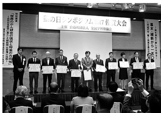
自主基準遵守塾表彰を受ける皆様

アイ・アカデミー（群馬県館林市） ING進学教室（東京都青梅市） 株式会社アイキューブ（長野県茅野市） IB早稻田鶴ヶ島校（埼玉県鶴ヶ島市）