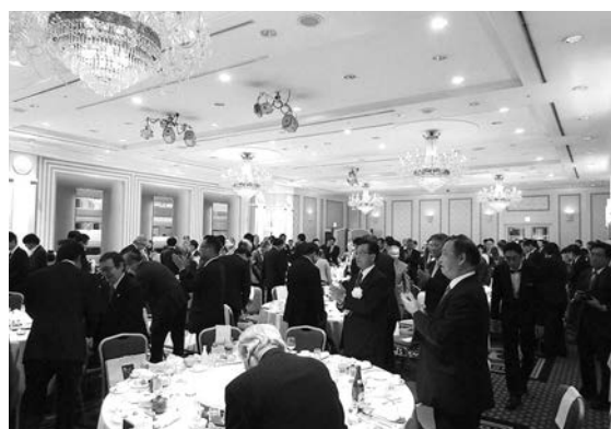
最後は博多手一本で手締め

塾の日シンポジウム2017 佐賀大会スタッフのみなさんご尽力ありがとうございました！！