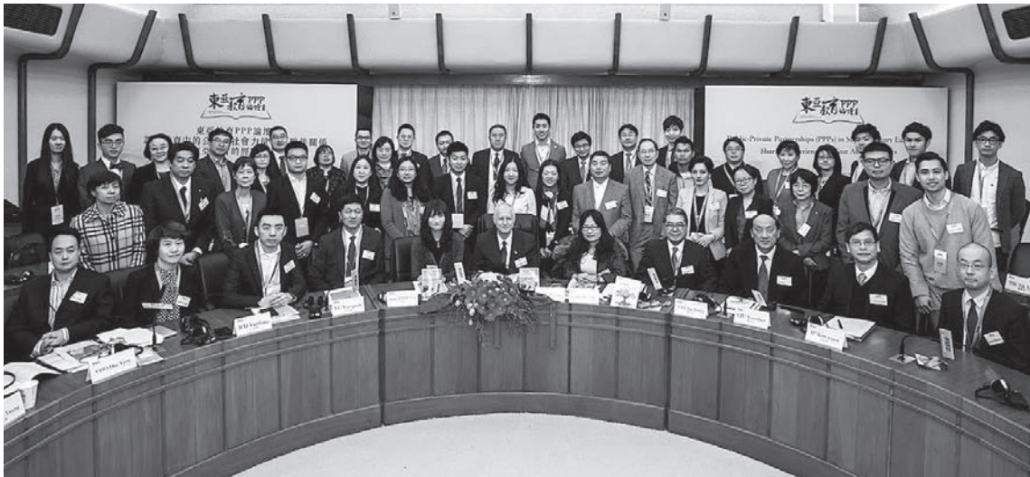
12月9日・10日に香港で開催された「補習教育における官民協働:東アジア地域での経験を共有する政策フォーラム」