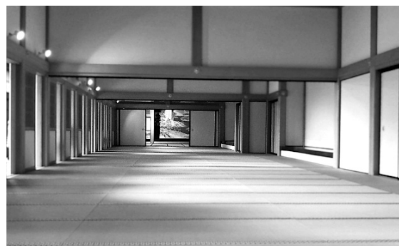
佐賀城本丸歴史館

ところで、私はスマートフォンを持っておりますけれども、20年前こんな物が出来るとは考えもしておりませんでした。これからの時代は、今までの進歩の時代よりも、もっと早い進化が訪れるはずで。この10年、20年、今ある仕事の約49%が、AI（人工知能）やロボットに取って代わられるという報告があります。この激動の時代を生き抜き、日本の未来、世界の未来が平和で豊かで幸せであるためには、ここにいらっしゃる生徒の皆さんをはじめ、日本中、世界中の子ども達、そしてこれから誕生する全ての子ども達が、正しい価値観を持ち、健全な精神を育み、個性豊かでチャレンジ精神を持つような教育をしていかなければならないと思っております。先程、これからの時代は今までとは比べきれない程のスピードで進化すると申し上げましたけれども、教育のやり方によっては、恐ろしい程の退化を生むかもしれません。憎悪と偏見によって、争いの世界になってしまう可能性もあります。今はまさしく、その大きな分岐点にあるのではないかと感じております。未来が退化しないためにも、私たち教育に携わる者だけではなく、社会の全ての大人が、子ども達の輝かしい未来のために、子ども達に真摯に向き合っていかなければならないと思います。このシンポジウムがそのための小さなきっかけになればと思っております。