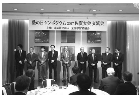
佐賀大会盛会の立役者の皆様に大きな拍手