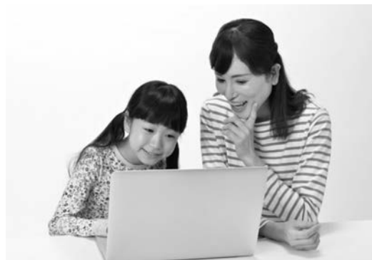
塾の安心を消費者はしっかり見えています！