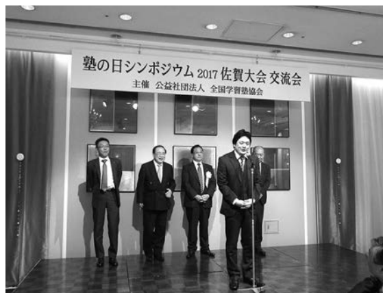
塾の日シンポジウム2018開催地メンバーの皆様