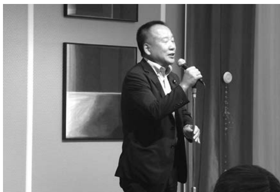
協会顧問・大島九州男参議院議員から塾にエール